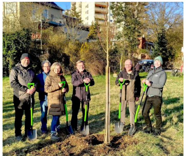
Die vom Bund Naturschutz gespendete Linde wird nach Vorbereitung durch die Stadtgärtnerei eingepflanzt.